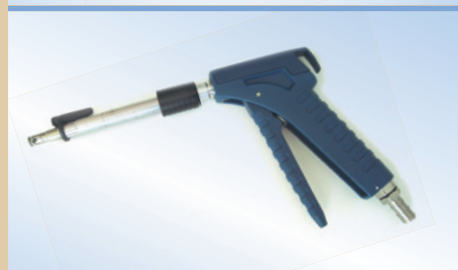
Bates Flex Inflator mit Click-on und Air-Release, Artikelnr. 096259