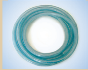
1/2" Schlauch (50 m) Artikelnr.: ..... 096035 3/8" Schlauch (50 m) Artikelnr.: ..... 096031