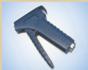
Griff für Inflator Artikelnr.: ..... 096060