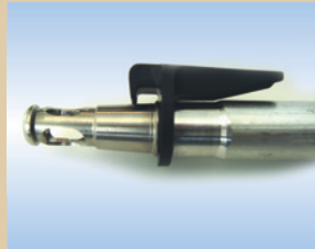
Befüllspitze, Flex Inflator, Aluminium, 80 mm, mit Click-on Artikelnr.: ..... 096240