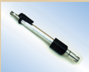
Befüllspitze, Flex Inflator, Aluminium, 150 mm, mit Click-on und Air-Release Artikelnr.: ..... 096228