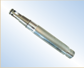
Befüllspitze, Flex Inflator, Aluminium, 80 mm Artikelnr.: ..... 096040