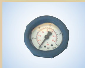
Manometer mit Schutzkappe (Ø40 mm - Skala 0-2,5 bar) Artikelnr.: ..... 096053