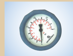
Manometer mit Schutzkappe (Ø63 mm - Skala 0-1,0 bar) Artikelnr.: ..... 096041