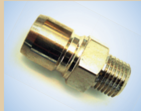
Kupplung (Vaterteil) für Standard/Flex Inflator und Quick Inflator (wird am Inflator zum schnellen Wechseln von Inflatoren angebracht) Artikelnr.: ..... 096069