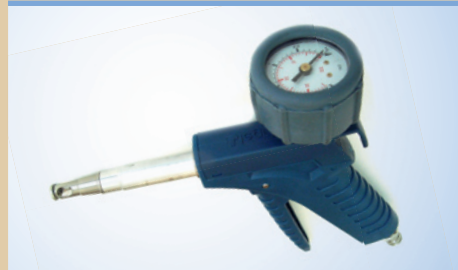
Bates Flex Inflator mit Ø 40 mm Manometer, Artikelnr. 096049