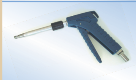
Bates Flex Inflator 150 mm mit Air-Release Rohr, Artikelnr. 096059