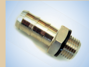
3/8" Schlauchnippel für Flex Inflator Artikelnr.: ..... 096057