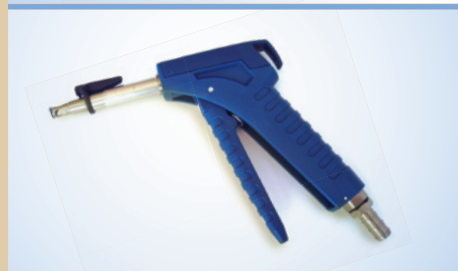
Bates Flex Inflator mit Click-on, Artikelnr. 096248