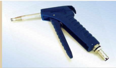
Bates Flex Inflator mit 80 mm Rohr, Artikelnr. 096048

Click-on: Der Bates Flex Inflator kann mit Click-on geliefert werden. Der Vorteil des Click-on besteht darin, dass die Befüllpistole am Ventil arretiert werden kann, so dass man zum Befüllen des Staupolsters nur eine Hand benötigt. Nach dem Befüllen wird die Befüllpistole durch leichten Druck auf die Sperrklinke gelöst