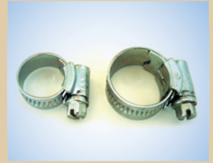
1/2" Klemmschelle Artikelnr.: ..... 096036 3/8" Klemmschelle Artikelnr.: ..... 096033