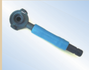
Schlauch und Greifkupplung für Quick Inflator Artikelnr.: ..... 096079