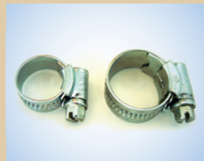
1/2" Klemmschelle Artikelnr.: ..... 096036