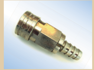
1/2" Schnellkupplung mit Ventil für Quick Inflator Artikelnr.: ..... 096051