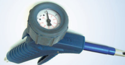
Bates Standard Inflator mit Ø 40 mm Manometer, Artikelnr. 096073