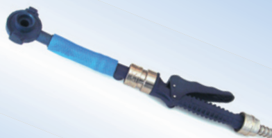
Bates Quick Inflator mit Schlauch, Artikelnr. 096077