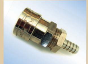
3/8" Schnellkupplung ohne Ventil für Quick Inflator Artikelnr.: ..... 096034