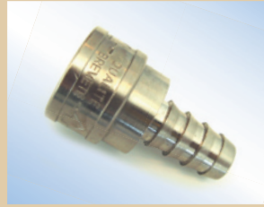
1/2" Schnellkupplung ohne Ventil für Quick Inflator Artikelnr.: ..... 096050