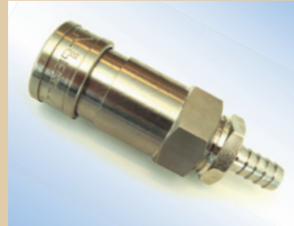
3/8" Schnellkupplung mit Ventil für Quick Inflator Artikelnr.: ..... 096030