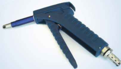
Bates Standard Inflator, Artikelnr. 096072

Befüllspitzen und anderes Zubehör können separat bestellt werden (siehe Rückseite)