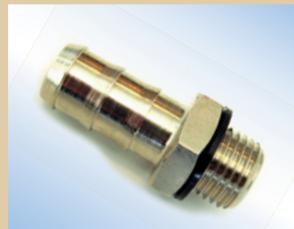
3/8" Schlauchnippel für Standard Inflator Artikelnr.: ..... 096057