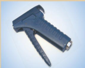
Griff für Inflator Artikelnr.: ..... 096060