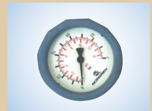
Manometer mit Schutzkappe (Ø63 mm - Skala 0-1,0 bar) Artikelnr.: ..... 096041