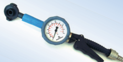
Bates Bates Quick Inflator, mit Schlauch und Manometer Ø 40 mm Artikelnr. 096075