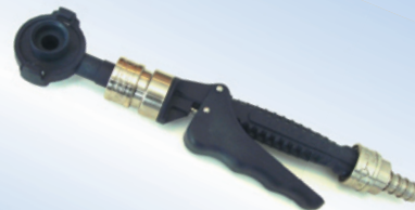
Bates Quick Inflator, Artikelnr. 096078

Die Greifkupplung und anderes Zubehör können separat bestellt werden (siehe Rückseite)