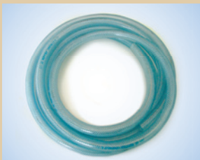
1/2" Schlauch (50 m) Artikelnr.: ..... 096035