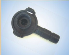
Greifkupplung für Quick Inflator Artikelnr.: ..... 096054