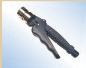
Griff für Quick Inflator Artikelnr.: ..... 096074