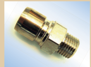
Kupplung (Vaterteil) für Standard/ Flex Inflator und Quick Inflator (wird am Inflator zum schnellen Wechseln von Inflatoren an- gebracht) Artikelnr.: .... 096069